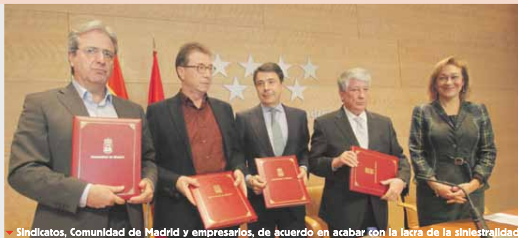
▼ Sindicatos, Comunidad de Madrid y empresarios, de acuerdo en acabar con la lacra de la siniestralidad.