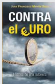
Autor: Juan Francisco Martín Seco Editorial: Península

Me ha gustado la película porque es un falso documental de la trastienda de un intenso momento político. Me ha gustado porque hay que seguir diciendo no en positivo y con alegría, defendiendo la alegría, que decía Benedetti. ■