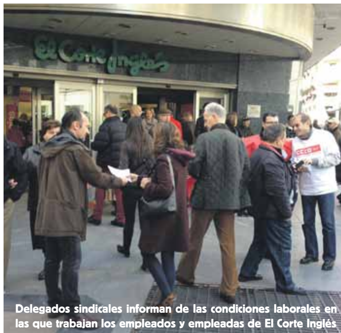
Delegados sindicales informan de las condiciones laborales en las que trabajan los empleados y empleadas de El Corte Inglés

En este sentido se da como acreditado que El Corte Inglés y este sindicato acordaron en mayo de 2008 el establecimiento de un plus adicional respecto del crédito horario previsto en el Estatuto de los Trabajadores, por lo que «ha de cumplirse lo