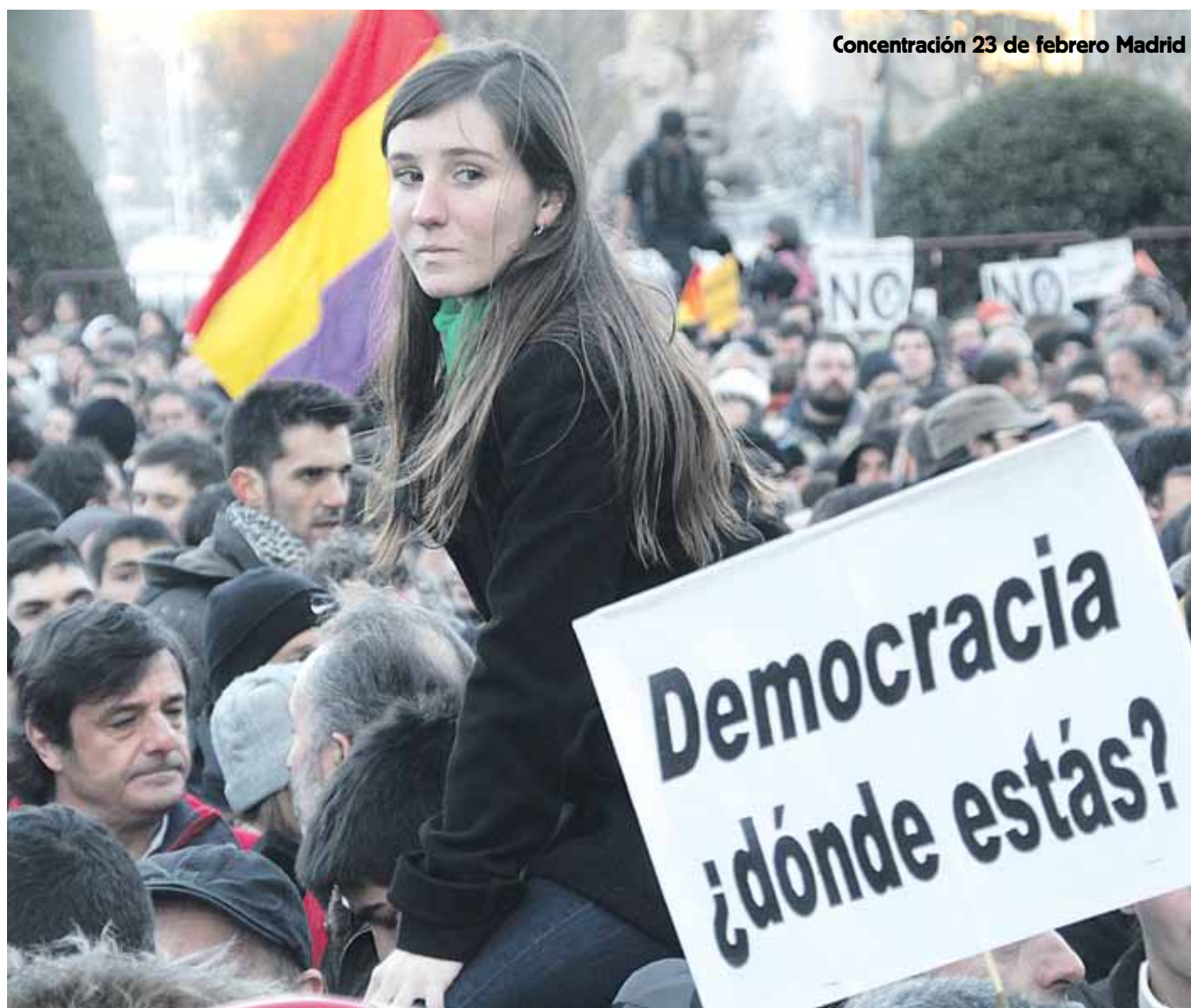
Concentración 23 de febrero Madrid

CCOO de Madrid considera que hay suficientes razones, verdes, blancas, naranjas, violetas, negras, rojas... para seguir exigiendo en la calle que este Gobierno regional debe rectificar y que no puede seguir gobernando a base de imponer una mayoría absoluta que desoye el grito de la ciudadanía. Por otra parte, estamos sufriendo un salto cualitativo en la forma en que la delegación del Gobierno aborda la conflictividad laboral. Son decenas las personas afiliadas a Comisiones Obreras que están sufriendo en primera persona un evidente retroceso en unos derechos civiles que tanto ha costado conquistar. Detenciones, golpes, procesos kafkianos... Ahora toca criminalizar la protesta laboral.