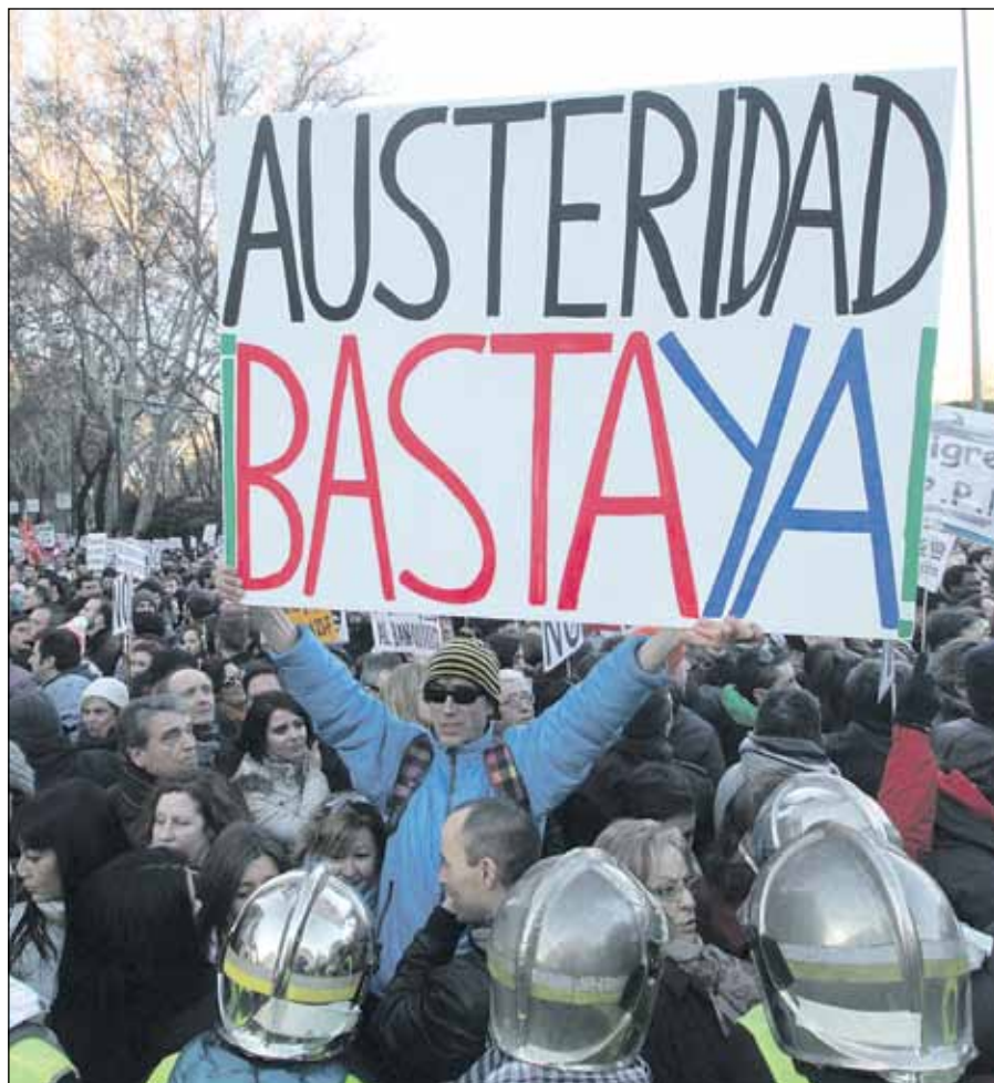
Decenas de miles de personas se manifestaron pacíficamente por las calles de Madrid

La Cumbre Social de Madrid, de la que forma parte este sindicato, apoyó y reforzó la convocatoria de mareas ciudadanas del pasado 23 de febrero. CCOO de Madrid, parte activa de la Cumbre Social madrileña, espacio de encuentro de diversas organizaciones sociales, profesionales, ciudadanas, vecinales, de mujeres, LGTB, de inmigrantes, etc., considera imprescindible que la ciudadanía siga mostrando con rotundidad su rechazo a las medidas de recorte de derechos que están poniendo en cuestión nuestro modelo social y democrático.