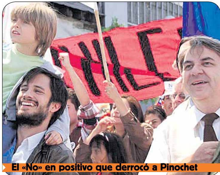
El «No» en positivo que derrocó a Pinochet