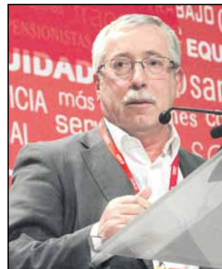
Gaceta Sindical @CCOO

Del 10º Congreso salen unas Comisiones Obreras reforzadas, renovadas y comprometidas con la gente, con esos «miles de trabajadores y trabajadoras que son despedidos silenciosamente todas las semanas, que son los que más nos necesitan», afirmó el reelegido secretario general de CCOO en la clausura de un Congreso que se ha cerrado con los delegados y delegadas aplaudiendo emocionados la interpretación del himno inédito a las Comisiones Obreras del compositor comunista Joaquín Villatoro y de la Internacional por parte del coro de la Fundación Gredos San Diego.