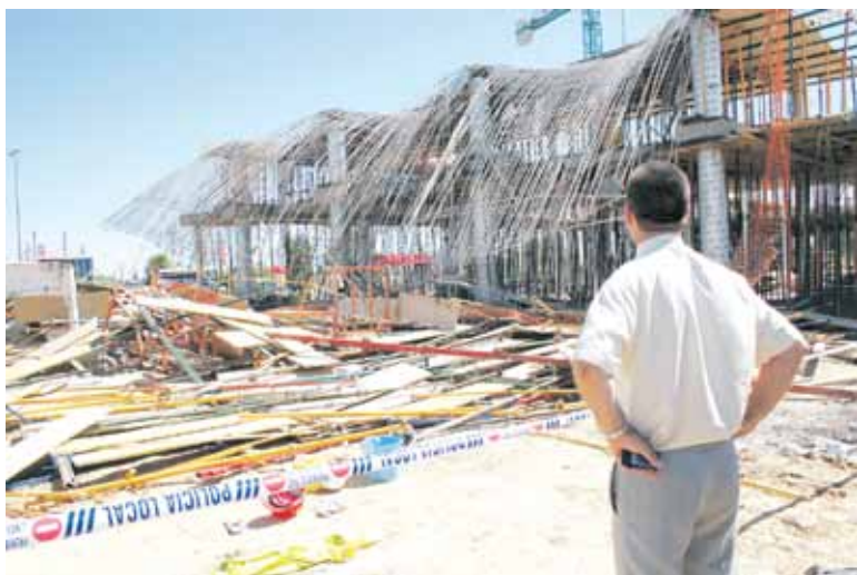
Debe ponerse en marcha el IV Plan Director en Prevención de Riesgos Laborales.

En el primer mes de este 2013 se produjeron en la Comunidad de Madrid un total de 6.129 accidentes laborales, 6 de ellos mortales y 23 graves. De la misma forma, se registró un importante incremento de los accidentes mortales en el sector servicios, pasando de 3 a 5 trabajadores fallecidos con respecto al año 2012, cifra que para CCOO de Madrid resulta «inaceptable».