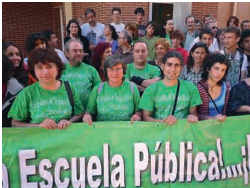
El pasado 26 de mayo, profesoras y profesores de Madrid protagonizaron encierros en defensa de la escuela pública de calidad.

Por otra parte, si el gasto hacia la enseñanza pública ha aumentado un 30 por ciento, el gasto dirigido a la privada con-