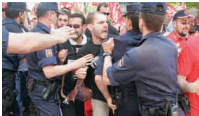
Los únicos responsables de los incidentes frente a la Asamblea de Madrid fueron los del Gobierno regional y el Grupo Popular.

«Una actuación de este tipo sólo se puede entender como una