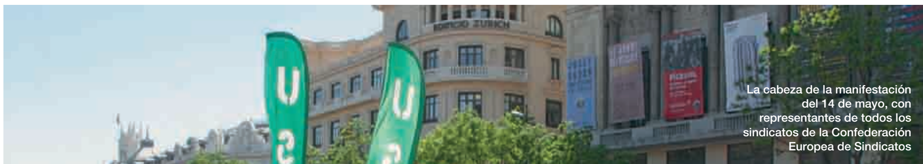
La cabeza de la manifestación del 14 de mayo, con representantes de todos los sindicatos de la Confederación Europea de Sindicatos