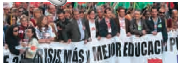
19 Aguirre suspende en educación

La euromanifestación de Madrid se vio desbordada en sus previsiones