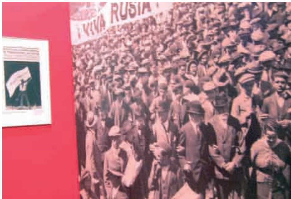
■ La exposición podrá visitarse gratuitamente en el Palacio del Infantado de Guadalajara hasta el 14 de junio. Su horario de apertura es de martes a sábado de 10 a 14 horas y de 16 a 19 horas, y los domingos de 10 a 14 horas.

Las revoluciones en Madrid han estado ligadas a la apertura para el pueblo de parques privados o reales, como ocurriera con el Retiro. Aquel 1º de Mayo de 1931 se abrió la Casa de Campo y las fotografías demuestran el alborozo popular. Es de destacar el video de unos dos minutos que presenta las únicas