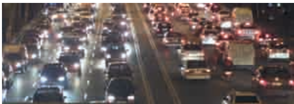
10 Más carreteras, más atascos