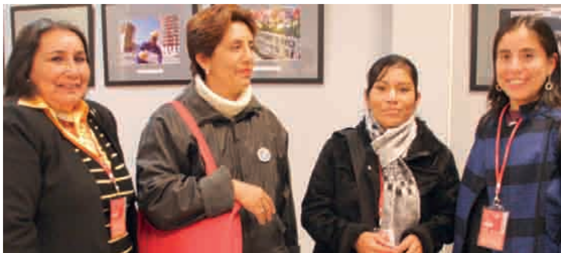
Delegación de mujeres peruanas invitadas por la Fundación al pasado congreso regional de CCOO de Madrid.

El principal objetivo del programa, cofinanciado por la Comunidad de Madrid, ha sido promover la participación de las mujeres reforzando sus organizaciones de base con el fin de brindarles herramientas y conocimientos que permitan consolidar sus liderazgos y fortalecer sus colectivos. De esta forma, la búsqueda de la equidad de género y su inclusión en los programas de desarrollo, que promueve la Fundación, ha sido cumplida con éxito. A lo largo de todo el período han pasado por las diversas actividades un número importante de mujeres hasta un total de 3.600, tanto del ámbito rural como del urbano.