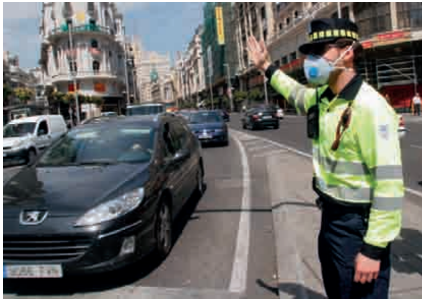
Un agente se protege de la contaminación en la confluencia de Gran Vía con Alcalá.

Otra reivindicación permanente de este servicio es el aumento de plantilla. Sólo cuenta con 500 agentes, a pesar de que serían necesarios mil, y ni si-