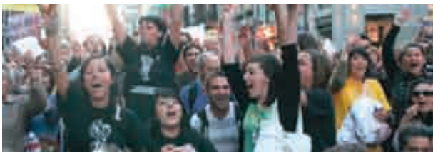
3 La juventud madrileña se mueve por sus derechos

COMISIONES OBRERAS DE MADRID • NÚMERO 136 • JUNIO 2009 • WWW.CCOOMADRID.ES