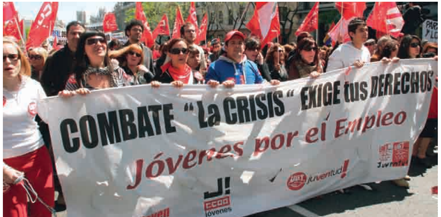
La juventud madrileña espera que, por una vez, sus problemas sean tenidos en cuenta por el Gobierno de Esperanza Aguirre.

Este abandono implica, según las organizaciones juveniles, varios trastornos directos para la juventud madrileña. Así, los jóvenes ven recortados sus derechos y