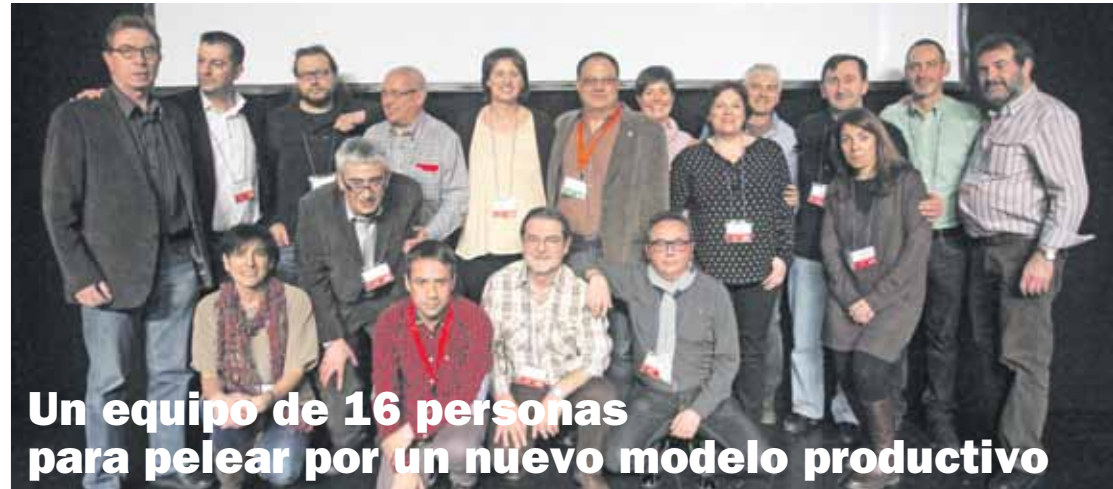
Un equipo de 16 personas para pelear por un nuevo modelo productivo

«A partir de ahora tenemos un nuevo y mejor instrumento para la clase trabajadora».