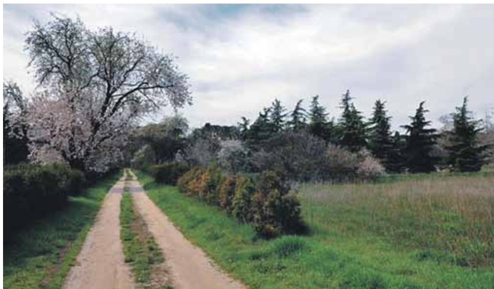
▲ Uno de los paseos que se extienden por los impresionantes jardines de Torre Arias

El Área de Medio Ambiente del Ayuntamiento de Madrid ha anunciado la apertura del parque de la Finca de Torre Arias (San Blas) para este próximo verano. Según los responsables del Área, los trabajos para el acondicionamiento de la instalación costarán al erario público 100.000 euros, pues se pretenden emplear los servicios de una empresa privada.