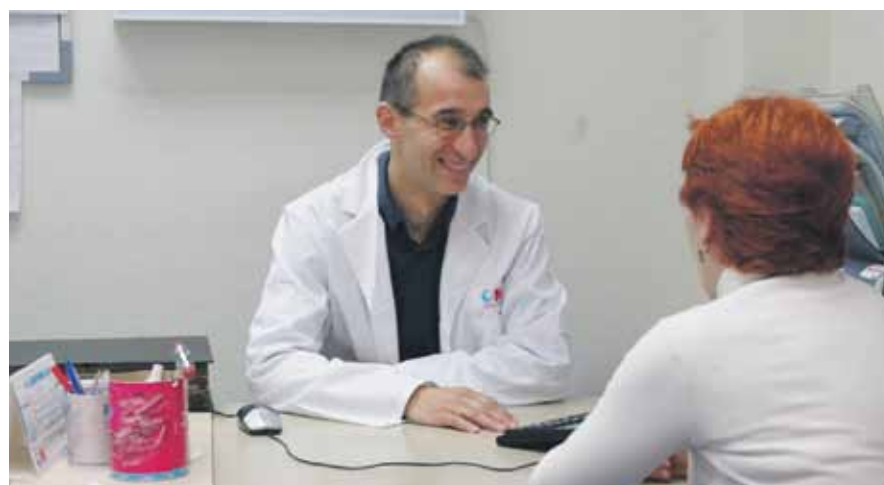
▲ En los años 2010 y 2011 la Comunidad de Madrid no hizo los reconocimientos

Tras reclamar este derecho en reiteradas ocasiones, la Comunidad de Madrid se limitó a comunicar la realización de 792 reconocimientos en 2010 y cerca de 300 en 2011, de un total de más de 45.000 trabajadores. Eso después de que no se