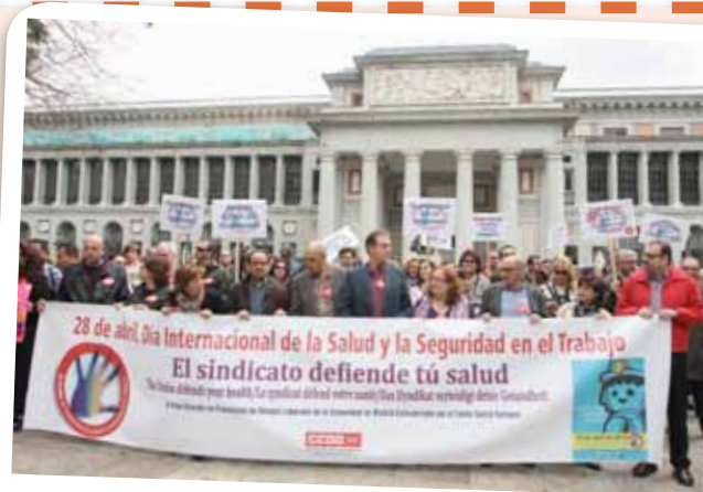
▼ Como cada año el 28 de abril nos concentraremos en defensa de la Salud Laboral. En la imagen, la concentración del año pasado.

Comisiones Obreras, a través de sus secretarías de Salud Laboral y de Medio Ambiente confederal, de territorios y de federaciones, está comprometida en la eliminación de los agentes cancerígenos y en la reducción de sus riesgos para trabajadores y medio ambiente. El compromiso del sindicato es informar, formar y apoyar a los trabajadores, así como intervenir en las empresas a través de los delegados y delegadas de CC00 para conseguir el eficaz cumplimiento de los principios de acción preventiva previstos en el artículo 15 de la Ley de Prevención de Riesgos Laborales, en relación a la exposición a agentes cancerígenos. El cáncer profesional es el que causa más muertes laborales en el mundo, por encima de otras enfermedades y accidentes de trabajo.