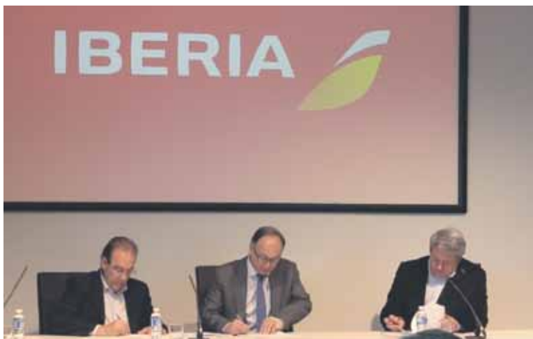
▲ El acuerdo afecta a unos 12.000 trabajadores de asistencia en tierra

CCOO ha alcanzado un acuerdo con Iberia que afecta a más de 12.000 trabajadores y trabajadoras del colectivo de tierra. Con este principio de acuerdo, todos los colectivos de la compañía están amparados por convenios colectivos, ya que el personal de tierra era el único que en la actualidad no tenía un convenio renovado.