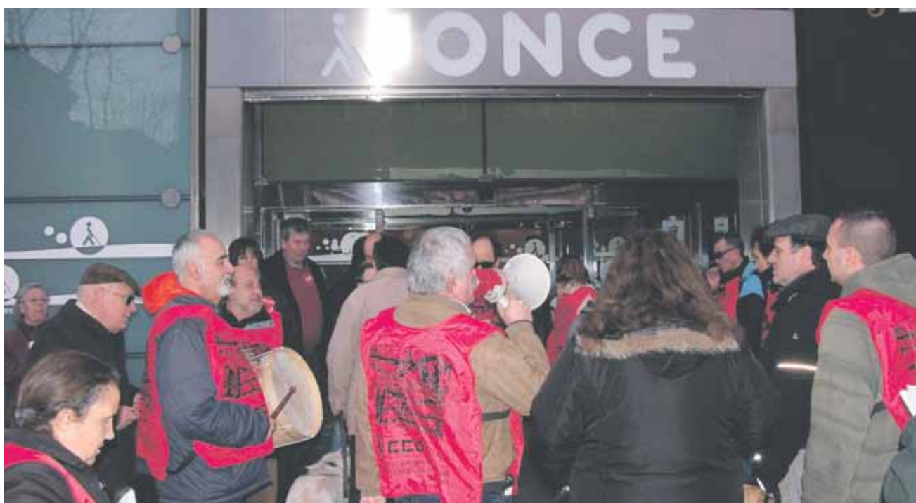
▲ El acuerdo ha sido posible gracias a la movilización de CCOO en la ONCE

En definitiva, si el trabajador tiene 56 años, padece alguna de las patologías amparadas por el RD 1851/2009, entre otras la polio, y tiene este porcentaje y esa patología hace más de 15 años, se puede jubilar. ■