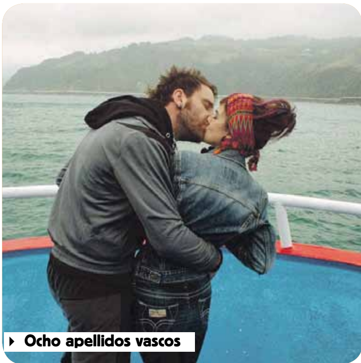
► Ocho apellidos vascos

A pesar del IVA con el que el Gobierno de Mariano Rajoy quiere acabar con la cultura, con el cierre de salas de cine y de teatros, queremos reírnos. Queremos que el cine y el teatro sean un oasis donde aparcarnos nuestros dramas y las tragedias que nos imponen. Obras de teatro como El crédito o películas como Ocho apellidos vascos llenan las salas. El fin de semana del estreno, 400.000 personas pasaron por taquilla para ver la película y llegó al puesto 15 mundial de películas más vistas. Eso, a pesar de Rajoy y del odio de Montoro por el cine español... Queremos reírnos. Hasta de nuestra sombra. La risa es una terapia y el cine y el teatro son terapias de masas.