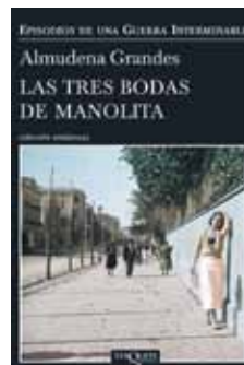
Autor: Almudena Grandes Editorial: Tusquets

Yo, que no me tomo las cosas a la tremenda, me lo he pasado bien. Y me han gustado los actores, especialmente Karra Elejalde en el papel de aita .