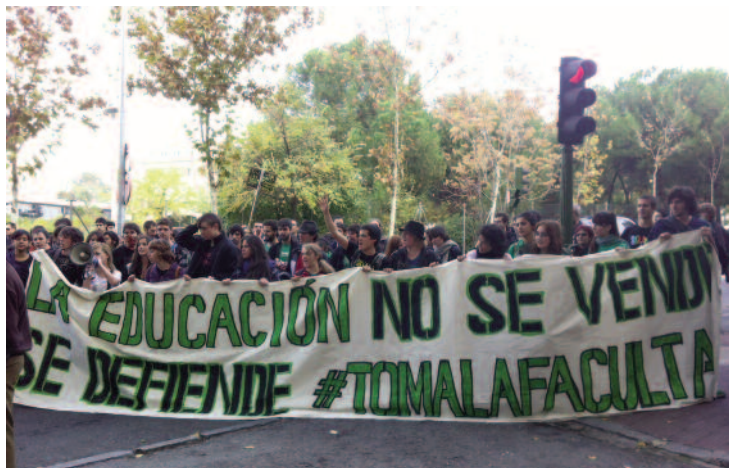
La manifestación de estudiantes durante su parada frente a la CRUMA coincidiendo con la concentración convocada por las secciones sindicales de CCOO en las universidades madrileñas.

Ese mismo día tuvo lugar una concentración convocada por CCOO frente al rectorado de la UPM, que preside actualmente la CRUMA, contra los recortes que están sufriendo las universidades públicas madrileñas.