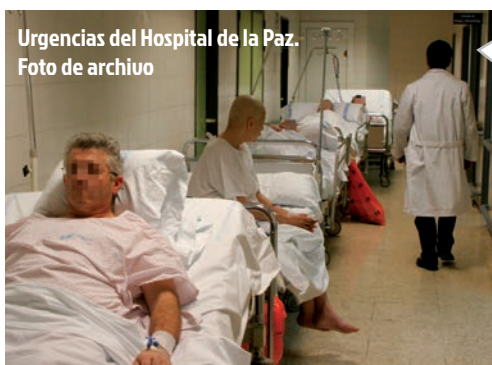
Urgencias del Hospital de la Paz. Foto de archivo

La Justicia ha declarado nulos los 180 despidos que se produjeron después de que el Gobierno regional privatizara los servicios no sanitarios del centro. CCOO muestra su satisfacción ante este nuevo revés a la privatización sanitaria de la Comunidad de Madrid.