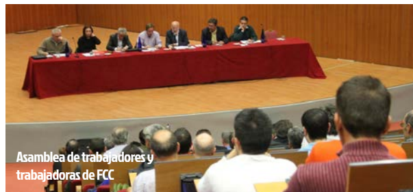
Asamblea de trabajadores y trabajadoras de FCC

El pasado miércoles, 20 de noviembre, comenzaron las primeras movilizaciones contra el ERE que acabará con más de 1.200 empleos. La Federación de Construcción y Madera de CCOO de Madrid (FECOMA-CCOO de Madrid) apoya incondicionalmente las movilizaciones llevadas a cabo por la plantilla de FCC Construcción.