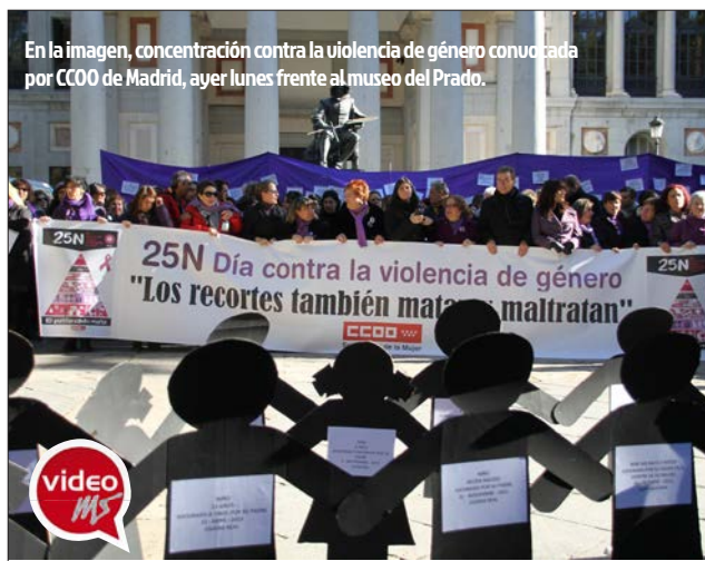
En la imagen, concentración contra la violencia de género convocada por CCOO de Madrid, ayer lunes frente al museo del Prado.

Coincidiendo con el Día Internacional contra la Violencia de Género, CCOO de Madrid ha presentado un informe en el que se da cuenta de cómo las denuncias siguen aumentando en la región, un 1% respecto al año anterior, hasta un total de 20.000 anuales.