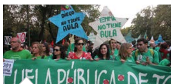
Nuevo conflicto en las oposiciones en enseñanza