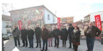
Las comarcas Norte y Sur, con los Abogados de Atocha

Martes, 10 de febrero de 2015 número 376