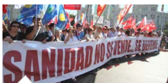
Este domingo vuelve la Marea Blanca