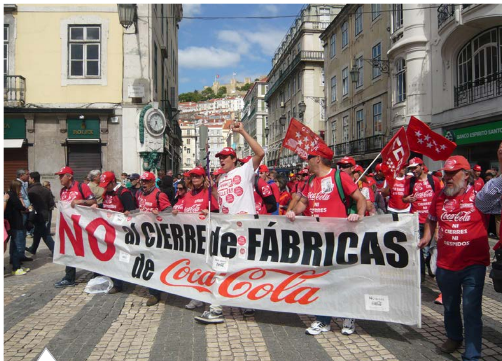
La lucha de Coca-Cola, también en Lisboa. La plantilla de Coca-Cola se manifestó el pasado sábado en Lisboa coincidiendo con la final madrileña de la Champions League. Centenares de trabajadores y trabajadoras marcharon por las calles de Lisboa, con el apoyo de la Uniao de Lisboa del sindicato CGTP, para exigir la retirada del ERE presentado por la empresa.