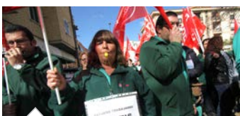
Continúa la movilización en la limpieza de Parla