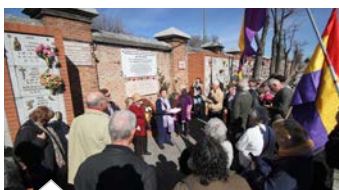
CCOO de Madrid homenajea a Las 13 Rosas