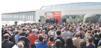
Actos en el aniversario de los atentados del 11M