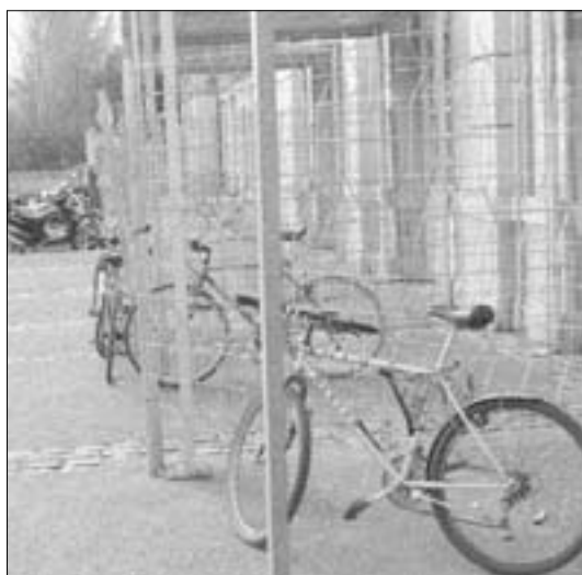
CC.OO. ve viable que se construyan aparcamientos para bicis en al menos 48 de los 98 apeaderos existentes.