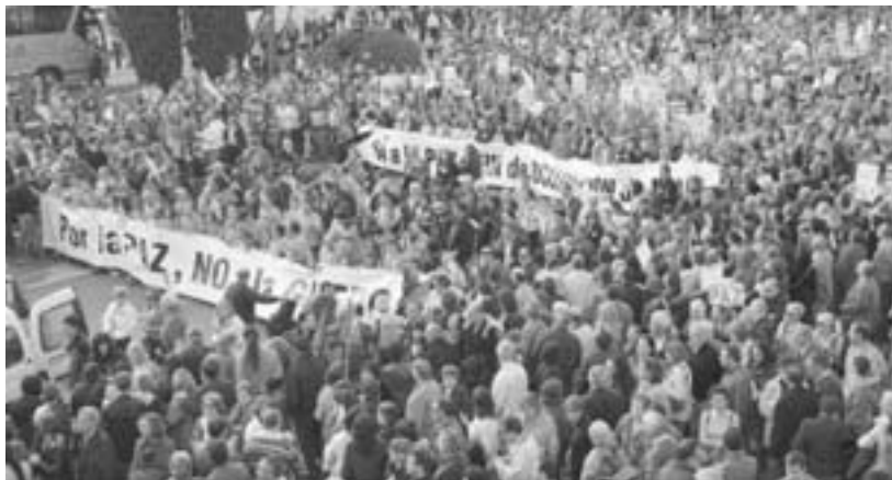
Momento de la manifestación a su paso por la plaza de Neptuno.

La manifestación, convocada por el Foro Social y apoyada por otras 100 organizaciones, también sirvió para protestar por otros conflictos además del iraquí. «El Sáhara no se vende», rezaba el estandarte de la Asociación Amigos del Pueblo Saharaui. «Fuera tropas de ocupación de Irak y Afganistán», decía el que portaban miembros del PCE. La protesta en la capital coincidió con otras manifestaciones en ciudades