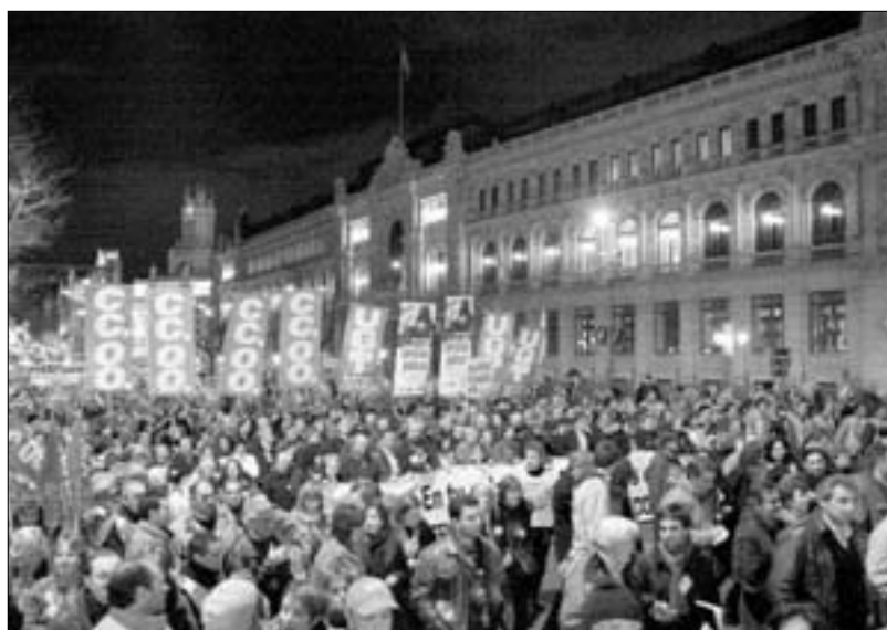
Miles de madrileños se manifestaron para pedir alto y claro «que los servicios públicos no pueden ser una fuente de negocio para los intereses privados de los amigos de Esperanza Aguirre».