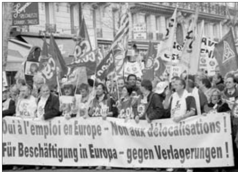
Imagen de la manifestación en París el pasado 15 de marzo convocada por la Federación Europea de Metalúrgicos en la que participaron unas 5.000 personas.