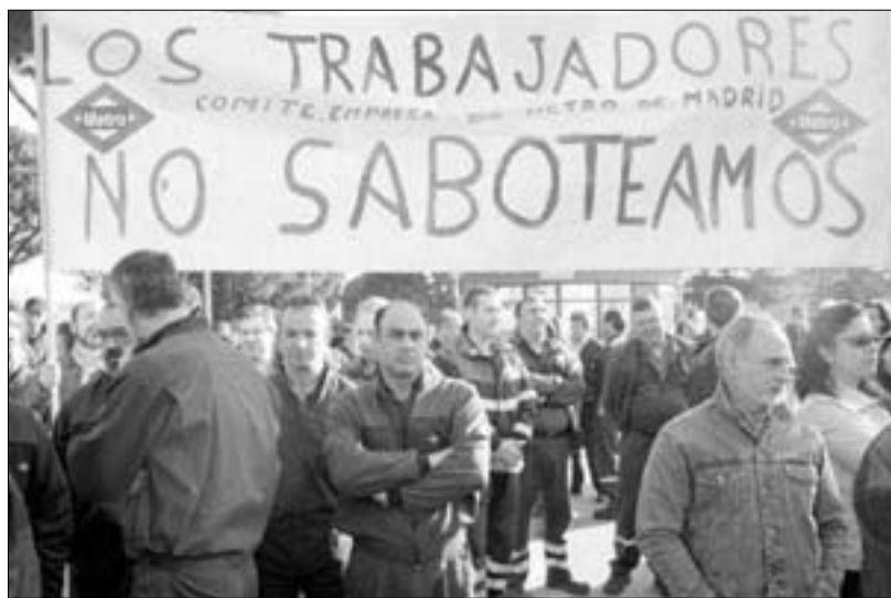
Imagen de la concentración de protesta llevada a cabo por los trabajadores el pasado 14 de marzo.

No fue el último incidente. El pasado 18 de marzo descarriló un convoy en la línea 7 sin que hubiera consecuencias personales. Ignacio Arribas explicó que el «descarrilamiento» pudo deberse a «que la uña