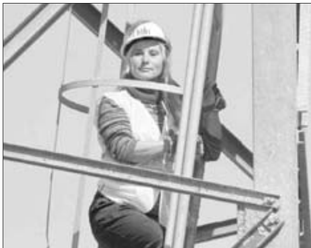
La presencia de las mujeres en algunos sectores, como el de la construcción, aún es mínima.

Para CC.OO., la Ley es un avance en la Igualdad de trato, en la protección de la maternidad y la paternidad e incentiva que