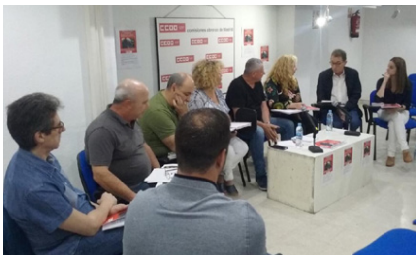
Pie de foto

CCOO sigue reclamando la contratación del personal necesario para un correcto funcionamiento de la red, ya que el déficit afecta incluso a la atención de las averías. Esta cuestión se echa en falta en el plan presentado recientemente por el Ministerio de Fomento, al que Cedrún ha pedido que aclare dónde están los 500 millones previstos para Cercanías en Madrid, ya que no aparecen en las partidas presupuestarias. Además, el sindicato cree necesario que se vuelvan a prestar con personal propio los servicios que han sido externalizados.