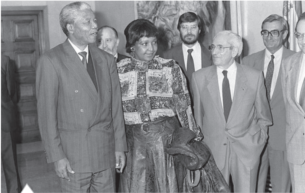
Nelson Mandela y Marcelino Camacho. El histórico dirigente surafricano visitó nuestro país por primera vez en 1991, un año después de salir de prisión. Para la ocasión, se organizó un comité de recepción cuya presidencia fue encomendada al fundador de Comisiones Obreras, Marcelino Camacho, dejando esta fotografía para la Historia.