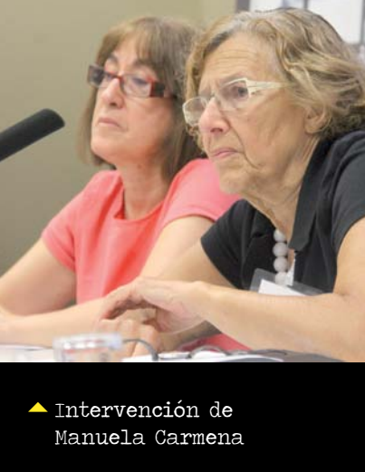
▲ Intervención de Manuela Carmena

Basándonos en estos datos, Manuela Carmena afirma que «no hay corrupción en la sociedad española, donde hay corrupción es en la clase política». Los funcionarios no son corruptos, los corruptos son los políticos. En España, aunque están separados los tres poderes, no lo están en su estructura, en la gestión. La estructura de la corrupción es muy grave y está en el