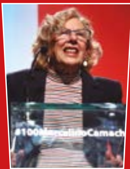
MANUELA CARMENA ALCALDESA DE MADRID

Precedido de un tráiler de la película que se presentará en mayo, “Lo posible y lo necesario”, que recorre la vida de Mar-