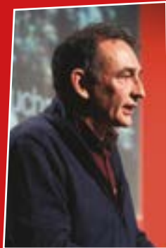
ENRIQUE SANTIAGO PCE

“El eco de tu voz sigue aquí bien audible, exigiendo pan, trabajo y libertad”