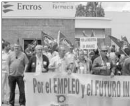
CCOO apuesta por el mantenimiento de todos los puestos de trabajo y por la viabilidad de la actividad industrial de este centro.

Los representantes sindicales aún no cuentan con la documentación que acredite las causas que justifiquen tal expediente ni el plan de acompañamiento social que contemple las medidas laborales que afecten a los trabajadores. La sección sindical de CCOO en Ercros advirtió que «no vamos a permitir que la aplicación desproporcionada de estas medidas pongan en serio riesgo la continuidad industrial de la división de farmacia».