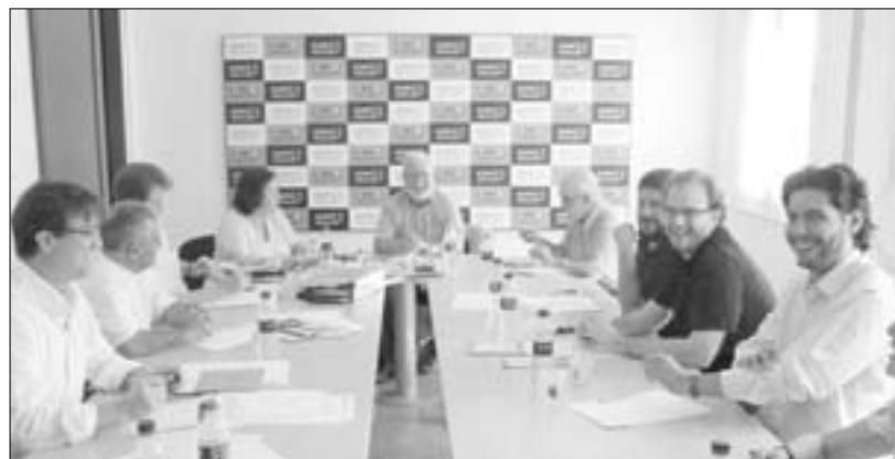
Los jóvenes de la región madrileña dedican hasta un 85 por ciento de su salario para acceder a un sitio donde vivir.

En cuanto a la vivienda, los datos indican que los jóvenes de la región tienen que dedicar hasta un 85