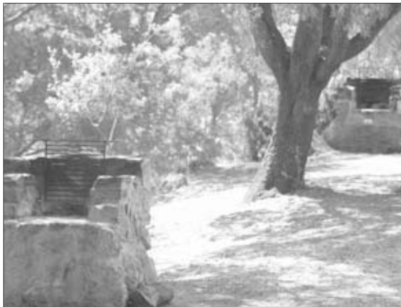
Barbacoa en un paraje de la sierra Norte de Madrid, cercano a Torrelaguna.