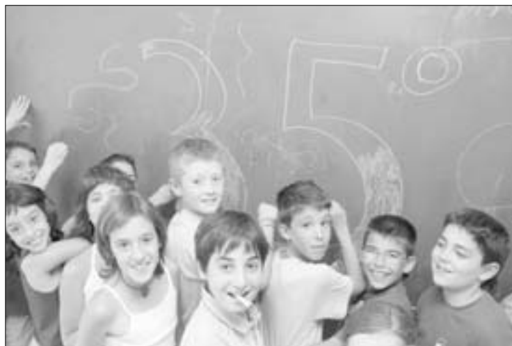
Alumnos del colegio Trabenco celebran el 35 aniversario de su centro.

«El Trabenco es un colegio abierto, se puede acceder a él por casi todos sitios y no hay vallas como en otros centros que pare-