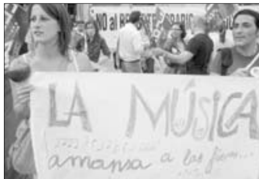
Concentración de los profesores de Música, quienes temen que la reducción horaria suponga también la pérdida de 150 puestos de trabajo.

Según el sindicato, el Gobierno regional realiza «un desarrollo trasnochado de la